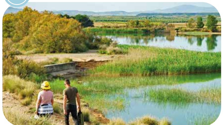
(ZEC ES2200041 Balsa del Pulguer. ES2200041 KBE, Pulguerko urmaela)

La Balsa del Pulguer es una de las Reservas Naturales de mayor interés de Navarra en la que coinciden aves acuáticas en el humedal con las aves esteparias de su entorno. Su ubicación dentro de la ruta migratoria transpirenaica hace que sea un lugar estratégico que las aves migratorias utilizan como áreas de reposo y alimentación. En este entorno se ha establecido un recorrido que circunda todo el espacio protegido y que permite la puesta en valor tanto de los elementos naturales como de la avifauna propia de la zona.