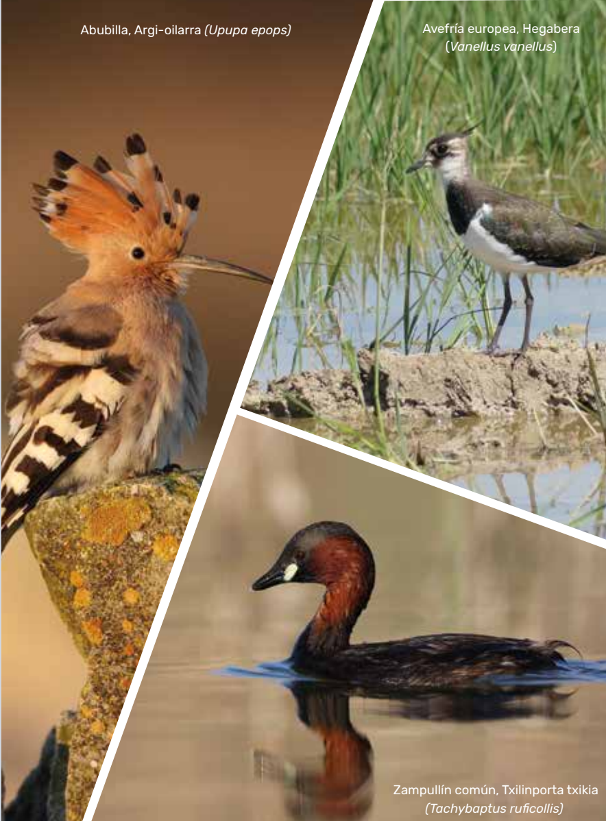
Abubilla, Argi-oilarra (Upupa epops)