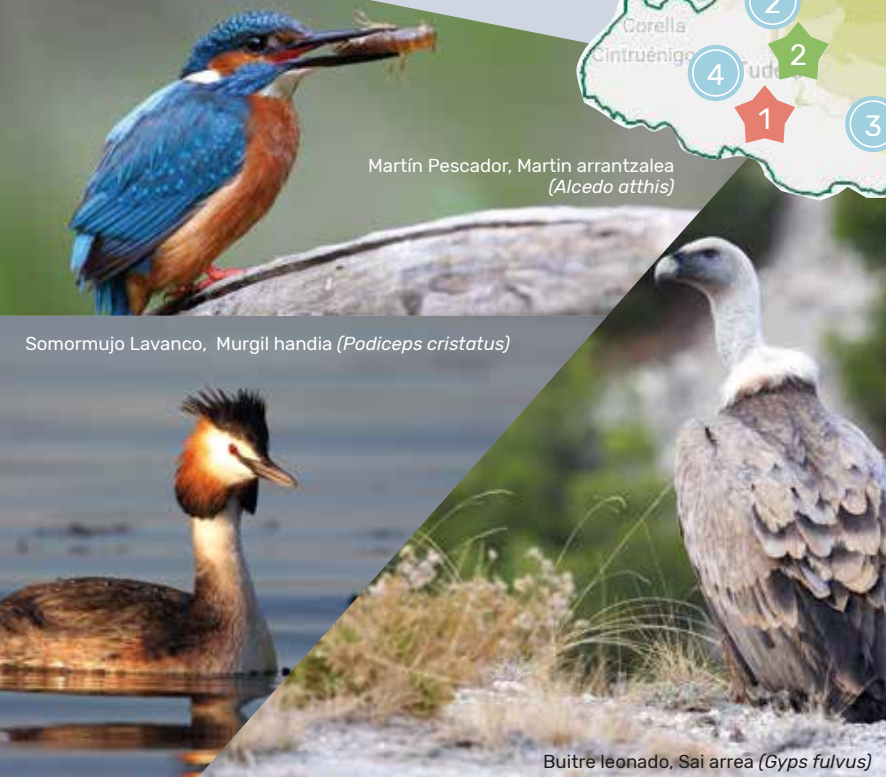
Martín Pescador, Martín arrantzalea ( Alcedo atthis )