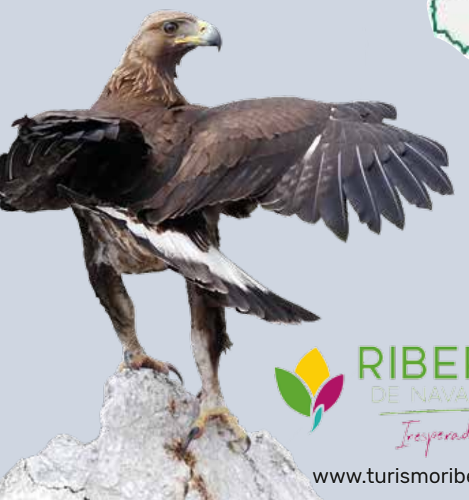
Águila real, Arrano beltza (Aquila chrysaetos)

Behatoki eta ibilbide ornitologiko hauek espezie garrantzitsuenak hartzeko duten ahalmenaren arabera hautatu dira. Gogoan izan behar da hegaztiak behatzen dituen pertsona orok kode etikoa errespetatu behar duela, faunari ahalik eta traba gutxien egiteko; bereziki, ugalketa-garaian.