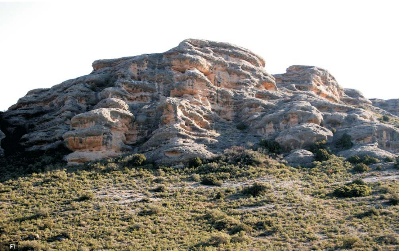
Macizo de Roscas (Fitero) [F1][F2][F3]

Dicen del Río Alhama, que es un río modesto. Es río de caudal delgado en verano, pero de grandes riadas en primavera y otoño. Serpentea por la vega que han formado sus aluviones y mantiene a su paso una orla de huertas y arboledas, dividiendo el viejo regadío del secano.